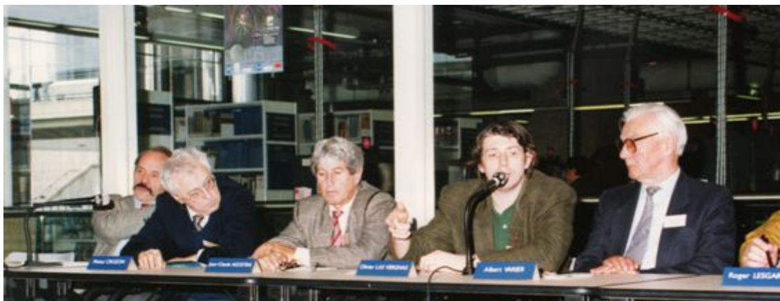
1993, Cité des Sciences de la Villette, Festival des Exposciences